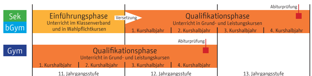
Abhängig von der Schulart dauert die gymnasiale Oberstufe zwei oder drei Jahre.

Für Bildungsgänge an Schulen besonderer pädagogischer Prägung müssen Sie mitunter zusätzliche Regelungen beachten, so beispielsweise an der Eliteschule des Sports und für die Züge im mathematisch-naturwissenschaftlichen Netzwerk.